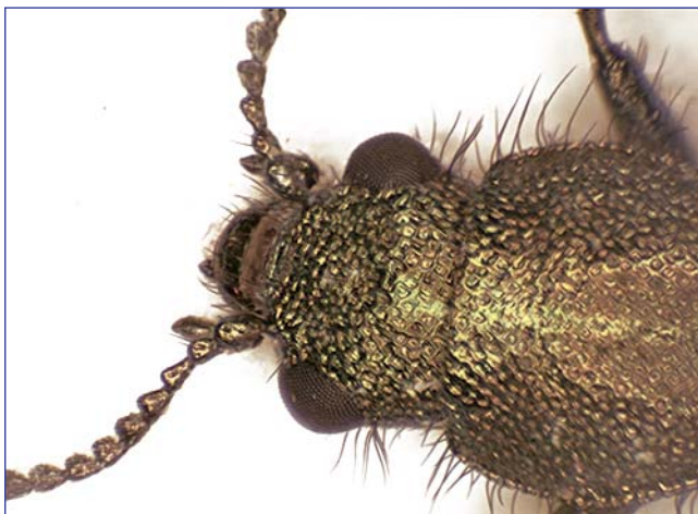
Mikroskop Novex RZT, kamera Infinity, . Složeno ze 7 obrázků